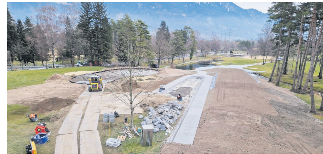
Die Abschlagbox von Loch 9 wurde komplett erneuert und erhöht.