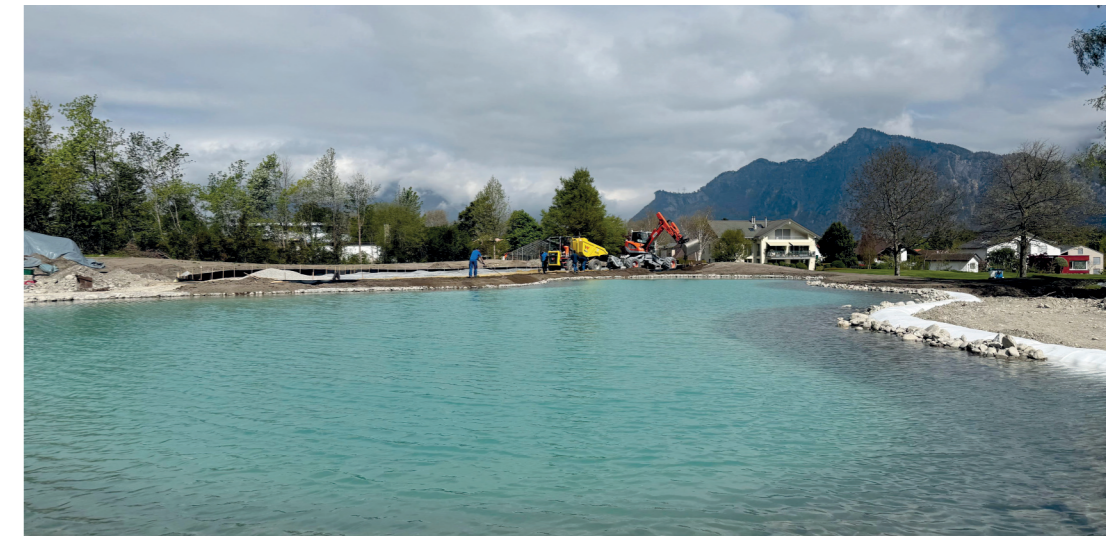
Der neue See auf dem «Signature Hole», der Spielbahn 12, wurde im April mit Wasser gefüllt.