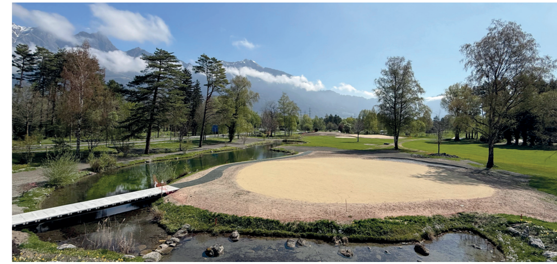
Sämtliche Greens auf dem Parcours wurden von Grund auf erneuert, wie hier Green 11.

Nachschub an Jungbäumen sicherzustellen, wurde auf der grossen Wiese bei Abschlag 13 eine eigene Aufzucht von Jungbäumen eingerichtet. Diese wird vom Greenkeeping-Team gepflegt, das sich in diesem Bereich gezielt weiterbildet. Im vergangenen Winter hat das Team zudem sämtliche schützenswerte Bäume auf der Golfanlage von Efeu befreit.